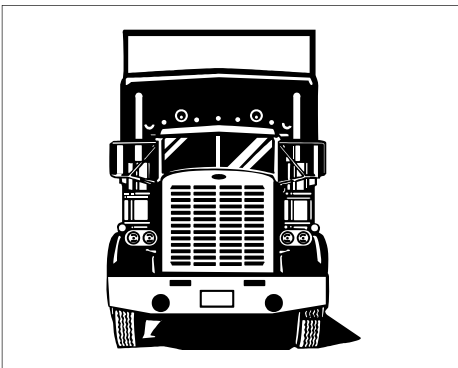
El sector transporte está a la expectativa de los acuerdos del COMIECO por su importancia

El pasado 23 de Agosto, en Comalapa, El Salvador se realizó la reunión del Consejo de Ministros de Integración Económica (COMIECO). En esa reunión también participaron los Presidentes de los Bancos Centrales y los Ministros de Economía y Comercio Exterior de Centroamérica.